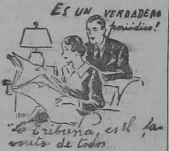
La tribuna, es el favorito de todos

Cuando la guerra termine espere fundadamente que la libere vuelva al comercio. Entonces nuestro café, acreditado en Inglaterra, recuperará de nuevo su puesto en Londres en donde las clases finas llegarán de nuevo a tomar su sitio para seguir siendo la bebida estimada y predilecta de un grupo de ingleses que desde hace un siglo toman y prefieren. Pero a la vez tendremos para las clases buenas un nuevo y poderoso mercado: el de los Estados Unidos en donde nuestro café puede abrirse un campo envidiable.