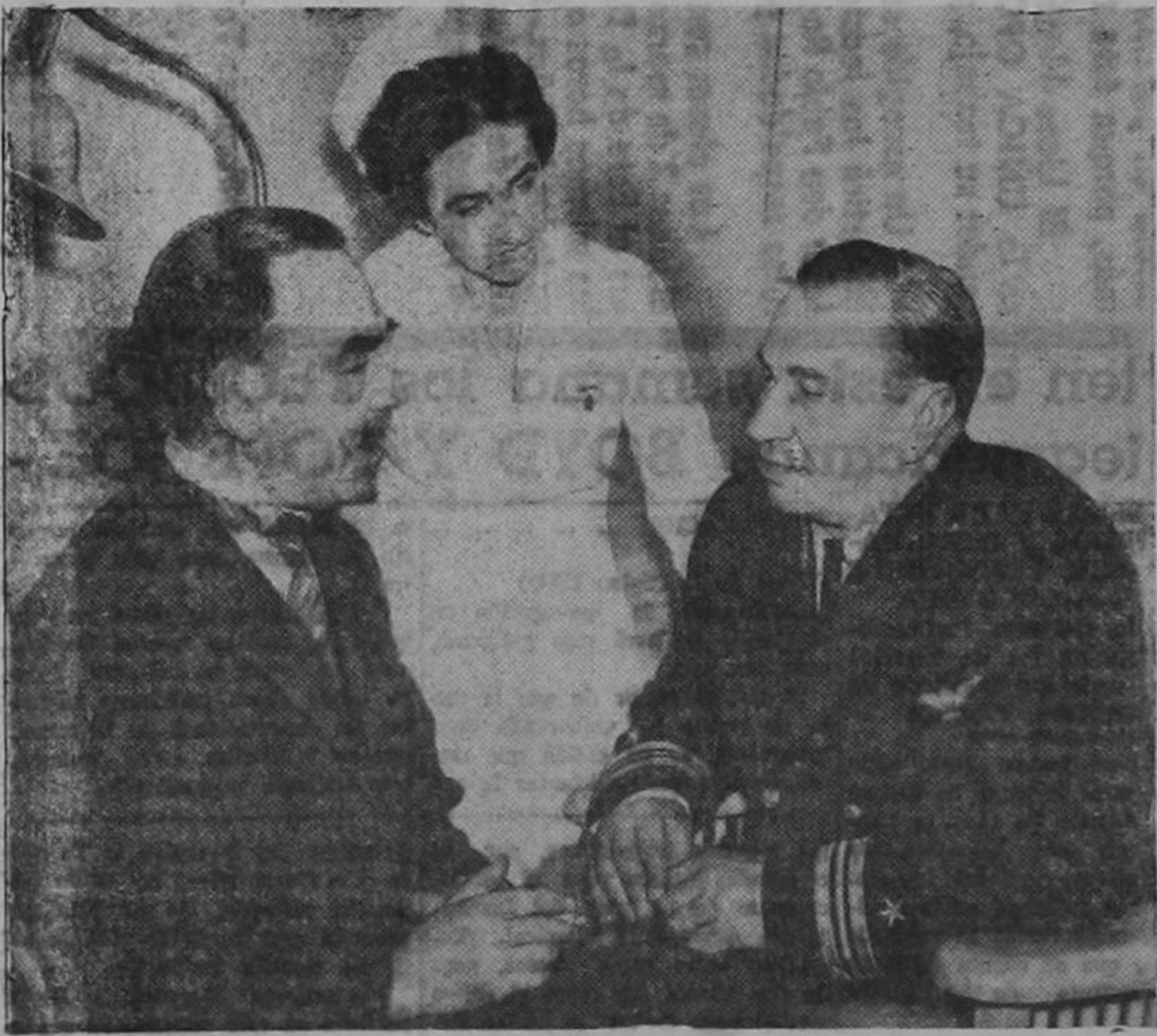
Esta no es una escena de una película, es el teniente comandante Wallace Beery, con uniforme de gala de la Marina norteamericana, fotografiado en la consulta del dentista, doctor B. Lucien Brun (a la izquierda). Mr. Beery está en servicio activo en las fuerzas navales.