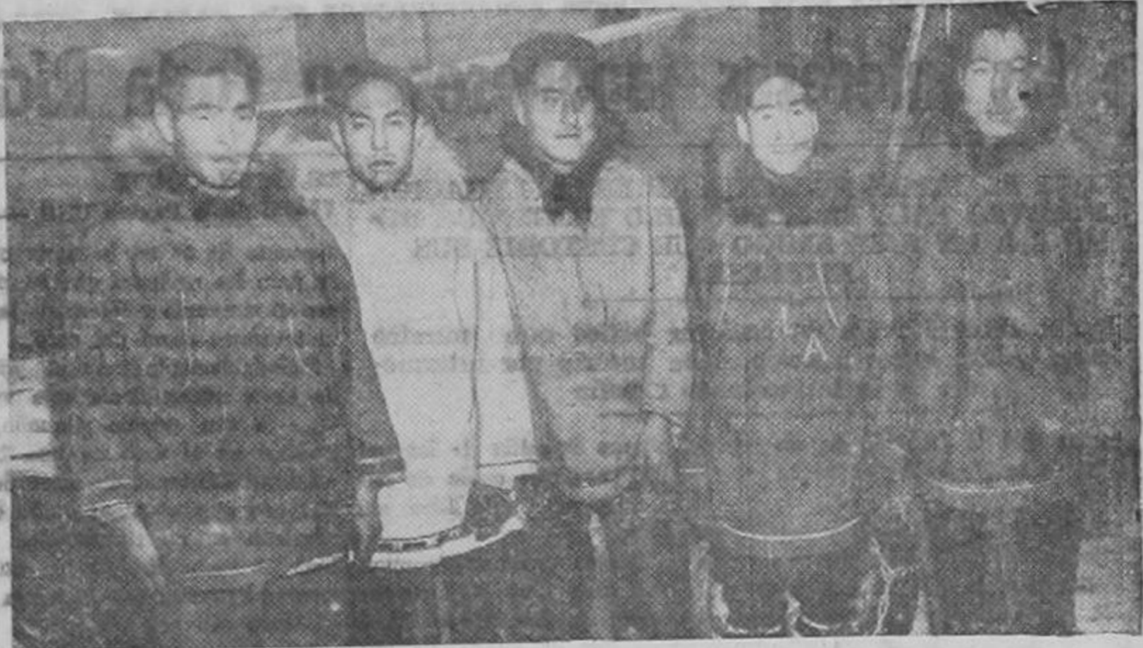
Desde Alaska, bajaron a alistarse en las fuerzas armadas norteamericanas, estos cinco esquimales, listos a defender al Tío Samuel. Los cinco pasaron los exámenes que se les hicieron.